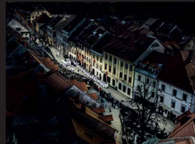
Jure Nastran Fotografije