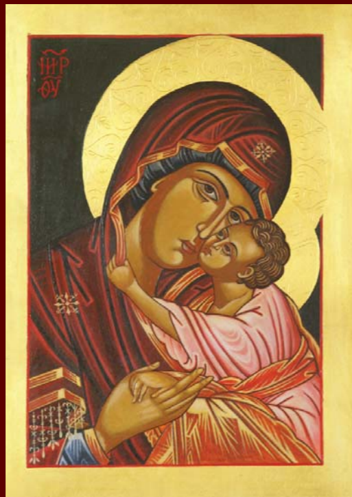
MATI BOŽJA Z DETETOM, 21 x 28 cm, jajčna tempera na lesu, pozlata 23 karatno zlato Vir: Dogmatika Teologična, 1990, Kopavce, Srbija