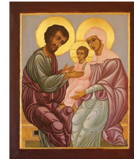
SVETA DRUŽINA, 25 x 30 cm, jajčna tempera na lesu, pozlata 23 karatno zlato Vir: neznan

PASIJON V IKONI, 59 x 80 cm, (Oznanjenje, Kristusovo rojstvo, Snemanje s križa in Objokovanje), jajčna tempera na lesu, pozlata 23 karatno zlato Vir: Samostan Sv. Katarine, Sinaj, 14. stol.