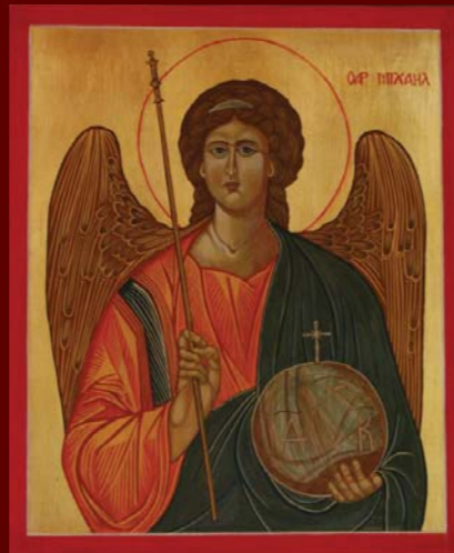
SVETI MIHAEL, 25 x 30 cm, jajčna tempera na lesu, pozlata 23 karatno zlato, 14. stol.