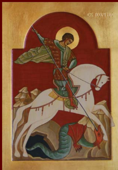
SV. JURJ, 25 x 30 cm, jajčna tempera na lesu, pozlata 23 karatno zlato Vir: Ruski muzej, San Peterburg, Rusija, 15. stol.