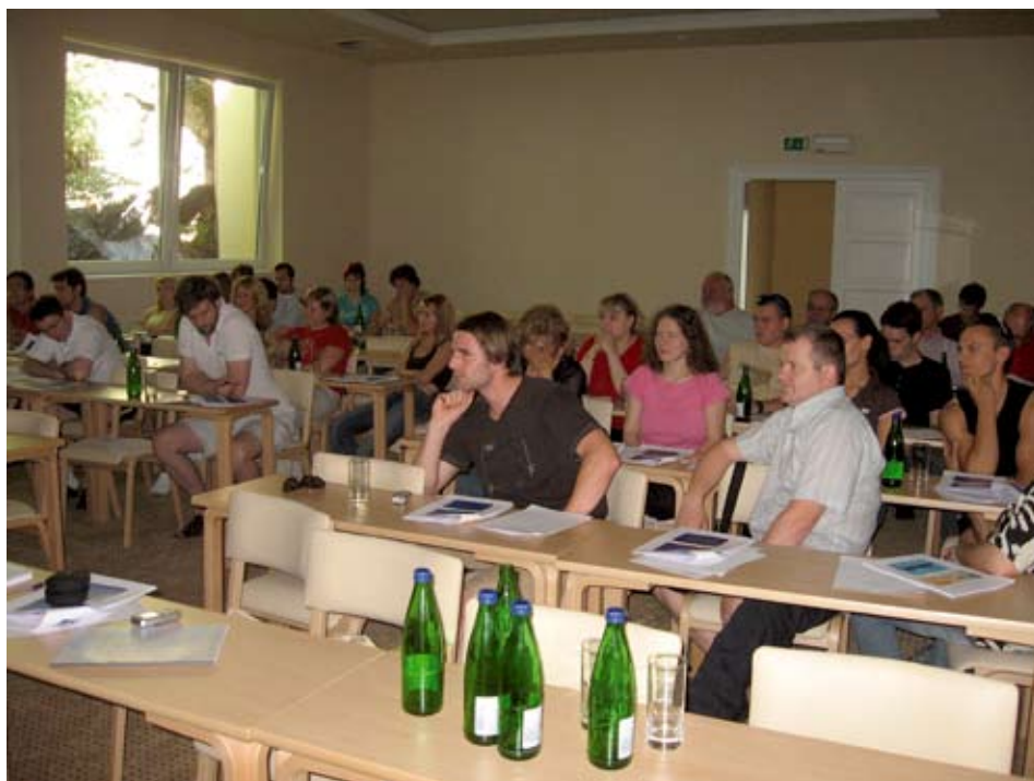
Udeleženci tečaja, ki se je odvijal v dvorani Pivka v Jamskem dvorcu.

V primerjavi z drugimi evropskimi državami imamo v Sloveniji dejansko najstrožje preventivne zaščitne ukrepe pred sevanji. To za naše podjetje pomeni velike obveznosti. Kot odgovorna oseba za varstvo pred sevanji sem zadolžena, da skrbim za spoštovanje zahtev zakonodaje in seznanjanje delavcev s temi zahtevami.