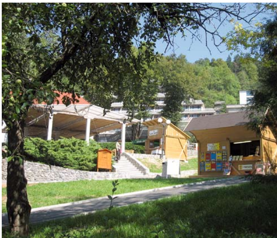
V parku Postojnske jame se širi ponudba Modrijanove domačije.