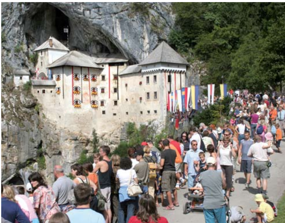
11. Erazmov viteški turnir je bil rekorden v vseh pogledih.

V veliki meri so letos radovednost in pričakovanja najmlajših potešili že vitezi v taboru, ki so se z njimi pomerili z lesenimi meči.